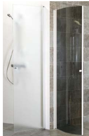
KASTE, kääntyvä suihkuseinä, suora

Lasivaihtoehdot: crepi, harmaa, pronssi, etsattu ja kirkas lasi sekä aqua styreeni.