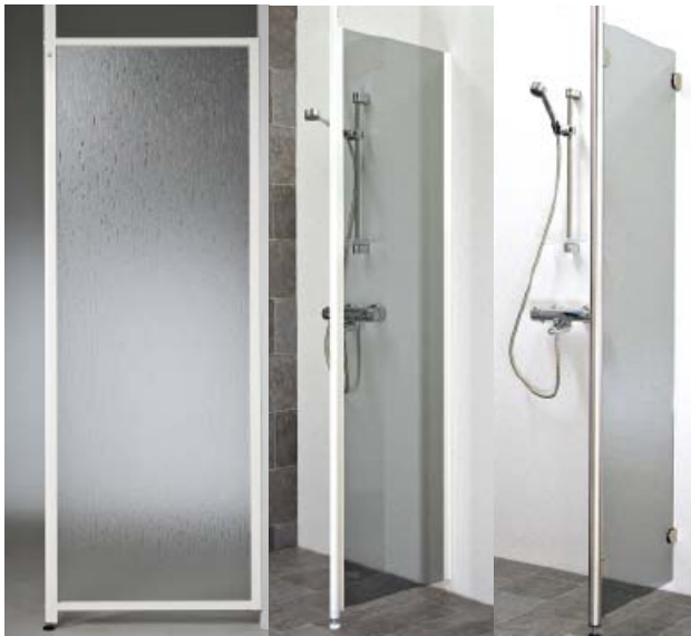
LILJA, kiinteä suihkuseinä