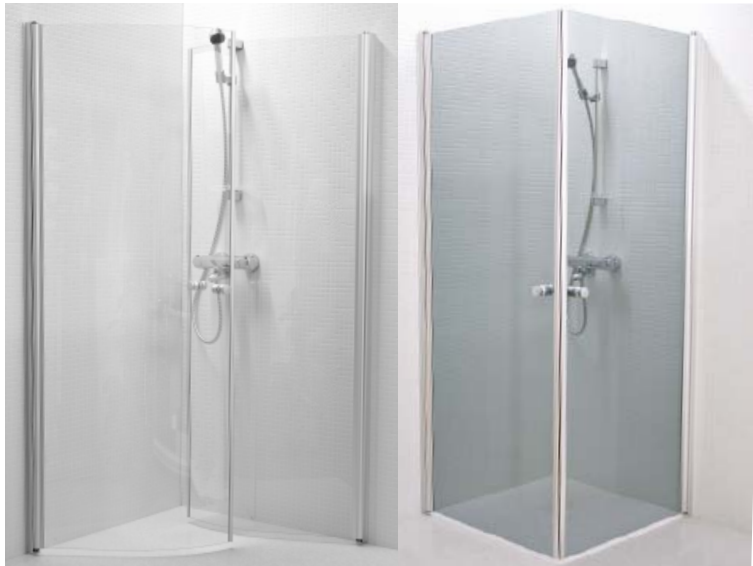
MILJA, kaareva suihkunurkkaus

Lasivaihtoehdot: crepi, harmaa, pronssi, etsattu ja kirkas lasi sekä aqua styreeni.